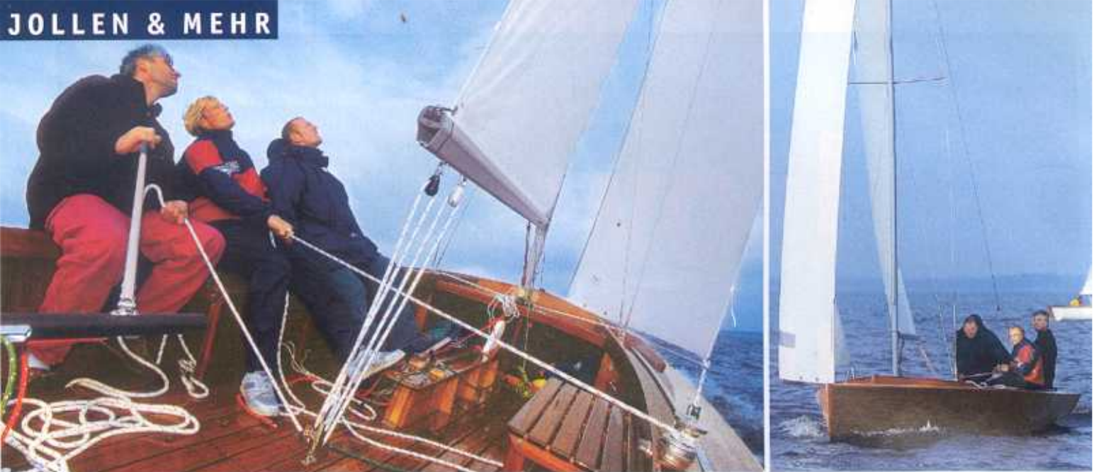
Auf der Kante: Die Seerose kann sportlich gesegelt werden, muß aber nicht. Für bis zu fünf Personen ist locker Platz im Cockpit.